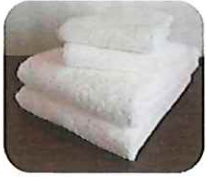
バスタオル・フェイスタオル