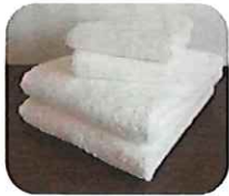
バスタオル・フェイスタオル

・バスタオル・フェイスタオル・甚平上下・病衣・介護つなぎ・リハビリ着上下(長袖)